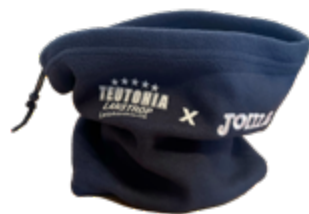
Halswärmer - 6,50 €