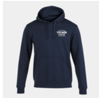
M20 - Hoodie - 28,00 € 5XS - 4XS - 3XS - 2XS - XS - S - M - L - XL - 2XL - 3XL