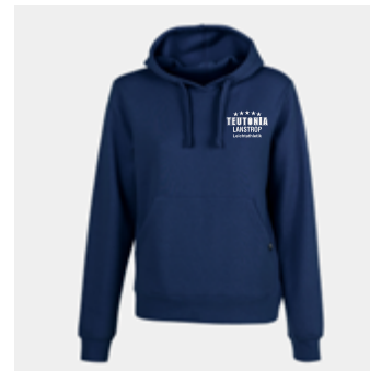
W30 - Hoodie - 24,80 € 3XS - 2XS - XS - S - M - L - XL - 2XL