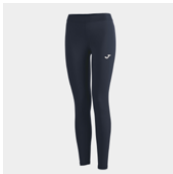
W26 - Tight - 30,60 € 4XS/3XS - 2XS - XS - S - M - L - XL