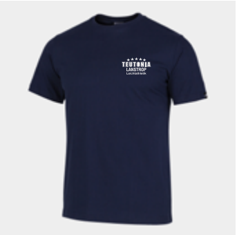
M12 - Baumwollshirt - 13,50 € 5XS - 4XS - 3XS - 2XS - XS - S - M - L - XL - 2XL - 3XL