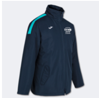
M17 - Winterjacke - 49,50 € 5XS - 4XS - 3XS - 2XS - XS - S - M - L - XL - 2XL - 3XL