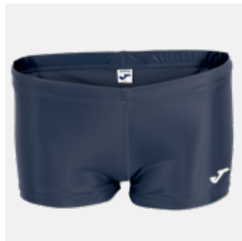
W05 - Short - 16,90 € 3XS - 2XS - XS - S - M - L - XL