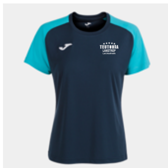
W11 - Premium-Shirt - 18,30 € 2XS - XS - S - M - L - XL - 2XL