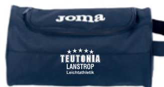
Shoe Bag - 9,20 €