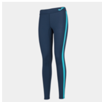
W25 - Stripe-Tight - 24,70 € 6XS/5XS - 4XS/3XS - 2XS - XS - S - M - L - XL