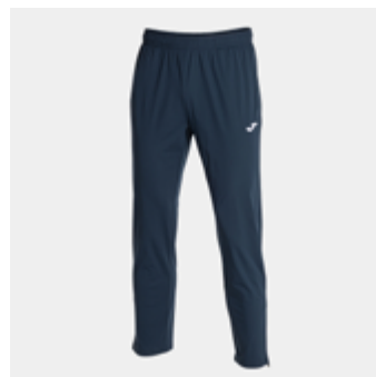
W28 - Trainingshose - 26,00 € 2XS - XS - S - M - L - XL - 2XL