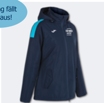
W22 - Winterjacke - 49,50 € XS - S - M - L - XL