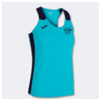
W15 - Top - 14,40 € 3XS - 2XS - XS - S - M - L - XL