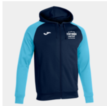
M15 - Jacke - 29,50 € 5XS - 4XS - 3XS - 2XS - XS - S - M - L - XL - 2XL - 3XL