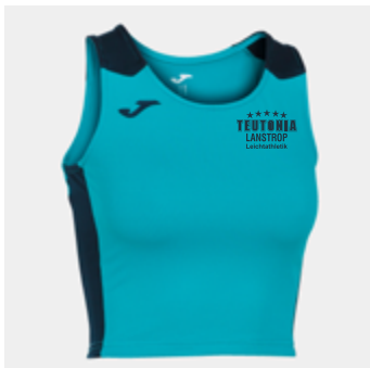
W01 - Trikot Oberteil - 19,60 € 3XS - 2XS - XS - S - M - L - XL