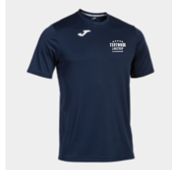
M10 - Sportshirt - 14,00 € 6XS/5XS - 4XS/3XS - 2XS - XS - S - M - L - XL - 2XL/3XL