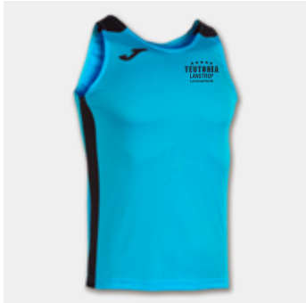
M01 - Trikot Oberteil - 15,00 € 3XS - 2XS - XS - S - M - L - XL - 2XL