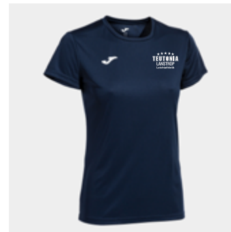
W10 - Sportshirt - 14,00 € 2XS - XS - S - M - L - XL - 2XL