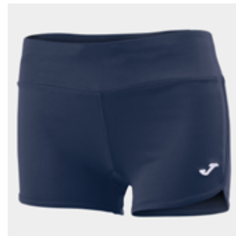
W07 - Panty - 15,00 € 2XS - XS - S - M - L - XL - 2XL