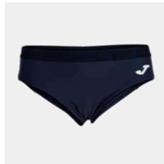
W06 - Brief - 14,30 € 3XS - 2XS - XS - S - M - L - XL