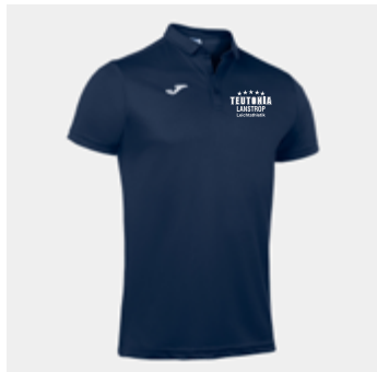
M13 - Poloshirt - 22,90 € XS - S - M - L - XL - 2XL