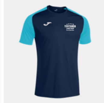
M11 - Premium-Shirt - 18,30 € 6XS/5XS - 4XS/3XS - 2XS - XS - S - M - L - XL - 2XL/3XL