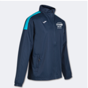
M16 - Regenjacke - 33,30 € 5XS - 4XS - 3XS - 2XS - XS - S - M - L - XL - 2XL - 3XL