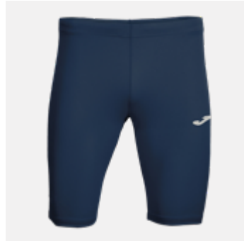
M06 - Short - 22,00 € 4XS - 3XS - 2XS - XS - S - M - L - XL