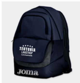
Rucksack - 24,20 €