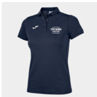
W16 - Poloshirt - 22,90 € XS - S - M - L - XL - 2XL