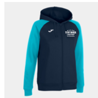
W20 - Jacke - 29,50 € 2XS - XS - S - M - L - XL - 2XL