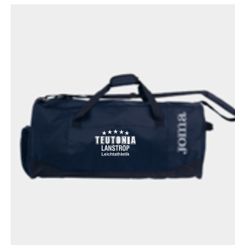
Sporttasche - 22,10 €

Achtung, die Joma Kleidung fällt bei einigen Artikeln klein aus, wir haben einige Artikel zum anprobieren im Vereinsheim, dafür gerne einfach melden.