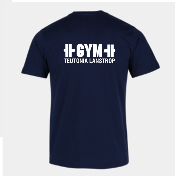
G01 - Baumwollshirt - 18,50 € 5XS - 4XS - 3XS - 2XS - XS - S - M - L - XL - 2XL - 3XL